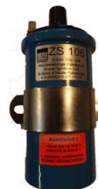
Bobine 12 volts Beru haute puissance Réf 70400 68 €