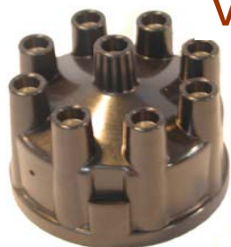
Tête Allumeur V 8 Versailles Réf 70318 €34,30