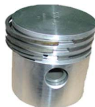
Jeu de 8 Pistons complets avec axes et segments Réf 20046 Ø 66mm Réf 20047 Ø 66,5mm €1129,50