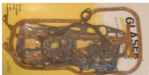
Pochette moteur V 8 Versailles Réf 170780 213,20 €