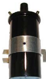
Bobine 12 volts Valéo Réf 70400 34,40 €