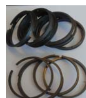
Jeu de segments Ø66,04x2,38x2,38x5R Réf 20175 €98,60