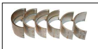
Coussinets palier depuis 1953 Réf 20770 standard (fabrication actuelle) €678,70