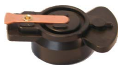
Rotor Ducellier RB V8 Versailles Réf 70303 €9,50