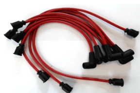
Faisceau allumage V8 Réf 11709 110,30 €