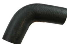
Durit inférieure V 8 Versailles Réf 110242 35 €