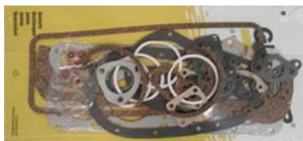
Pochette de joints moteur moteur 11 perfo réf A36606