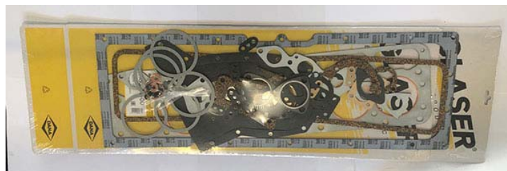
Pochette de joints moteur moteur 15x6 réf 170235