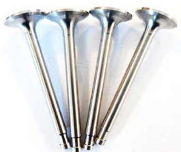
4 soupapes admission moteur 11 perfo réf 10080A