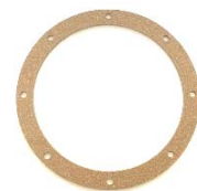
Joint de trappe de carter d'huile 15x6 réf 170243